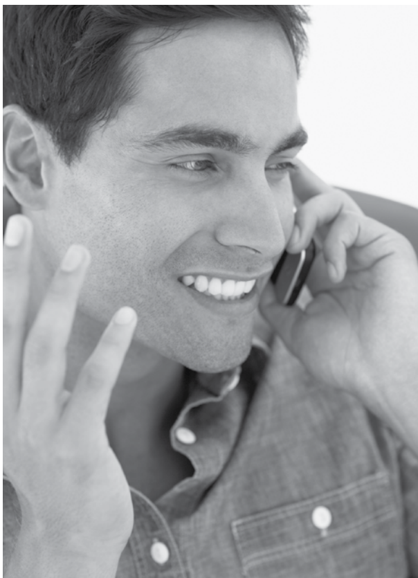
HCA 2016-059 SPA